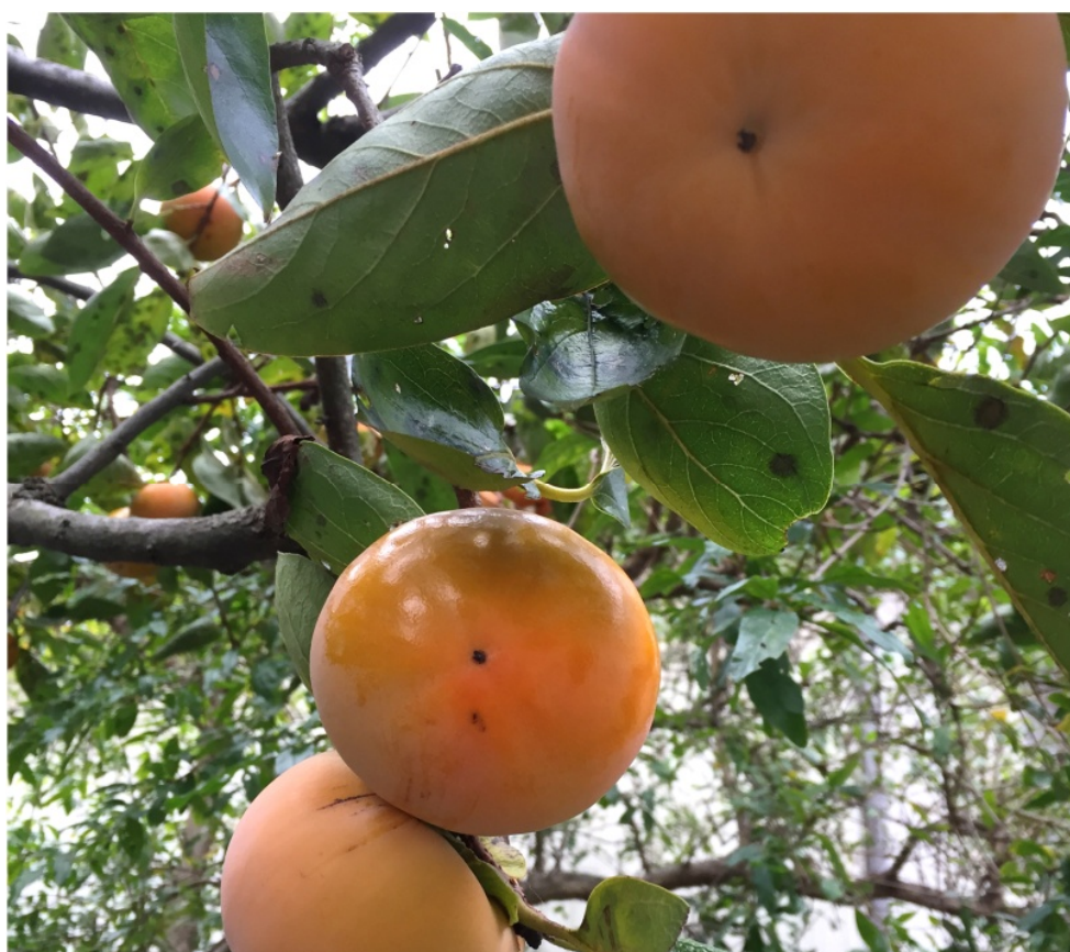
( 富有柿 )