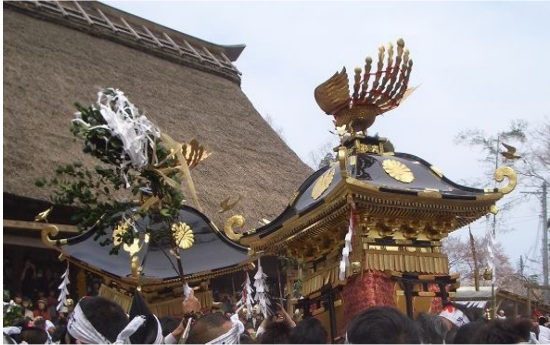
( 糸魚川けんか祭り )