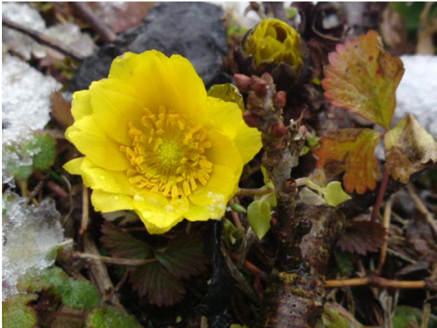
( 福寿草 )