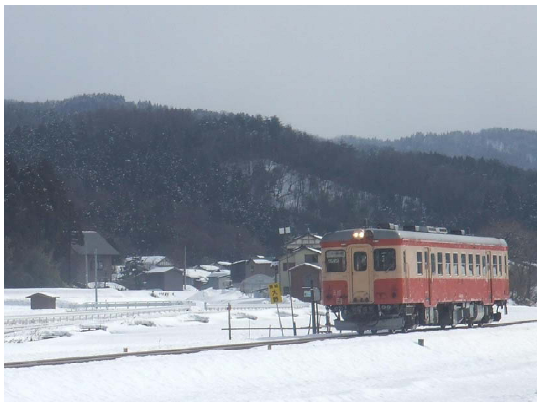
( 雪の大糸線 )